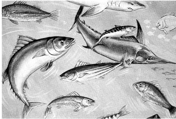
En el mar, ríos y lagos del Perú hay muchos recursos naturales (peces).