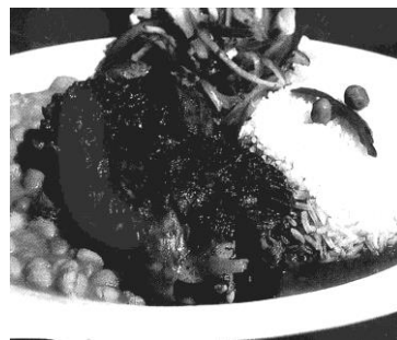
Seco de cabrito