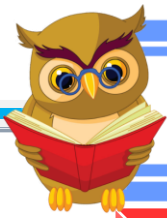
TABLA DE MULTIPLICAR DEL 5